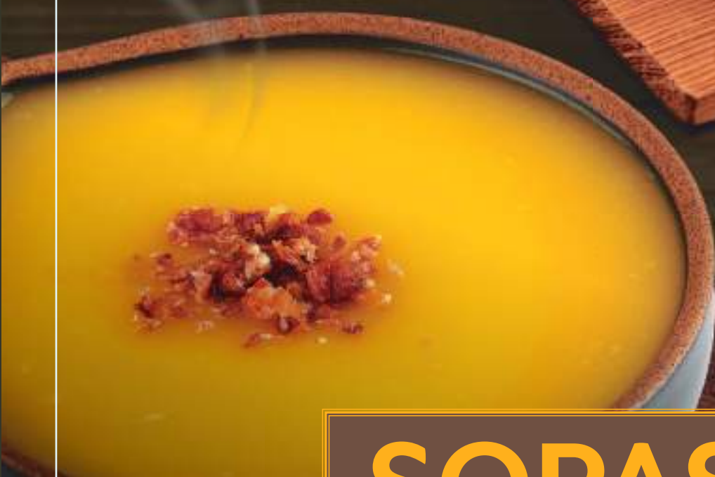
Creme mandioquinha ✦ (Bacon opcional sem custo) (Add bacon without cost)