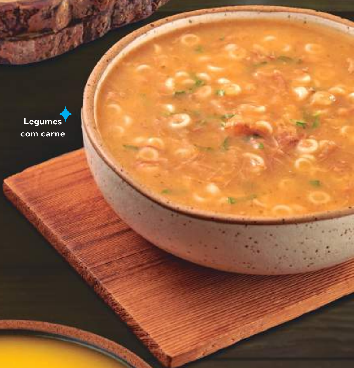
Legumes com carne ✦