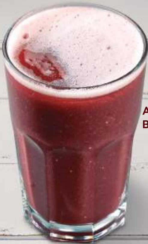
Açaí, Laranja, Banana e Morango