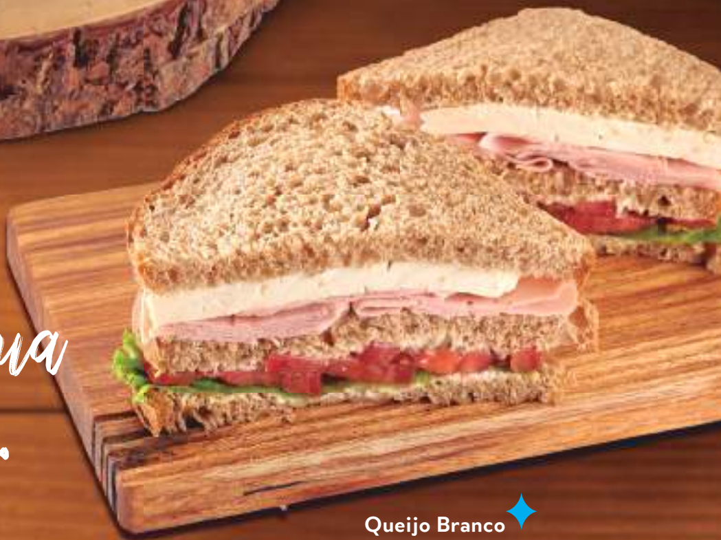
Queijo Branco e Peito de Peru