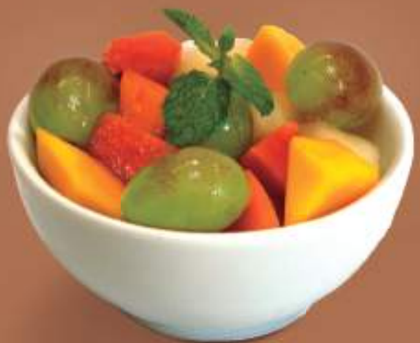
Salada de frutas