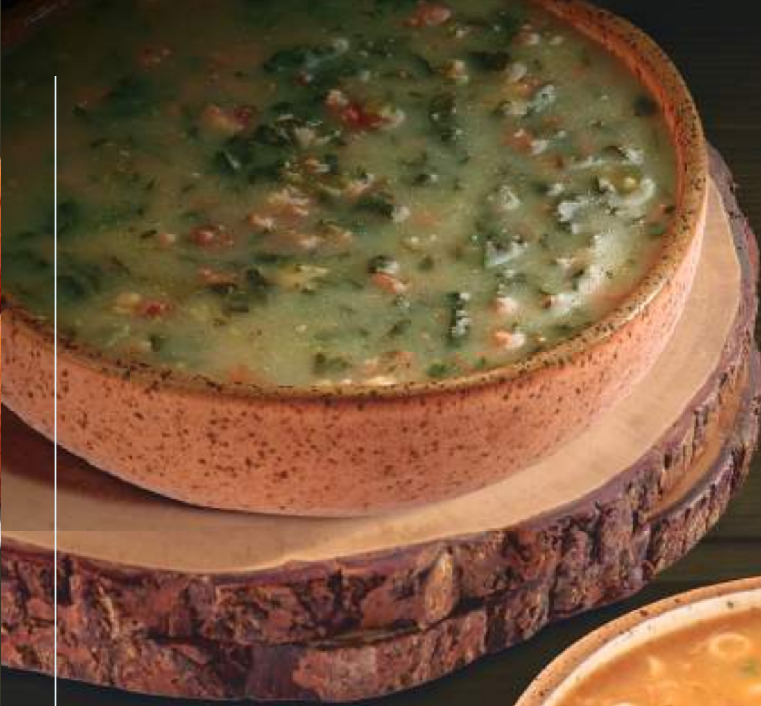
Caldo Verde ✦