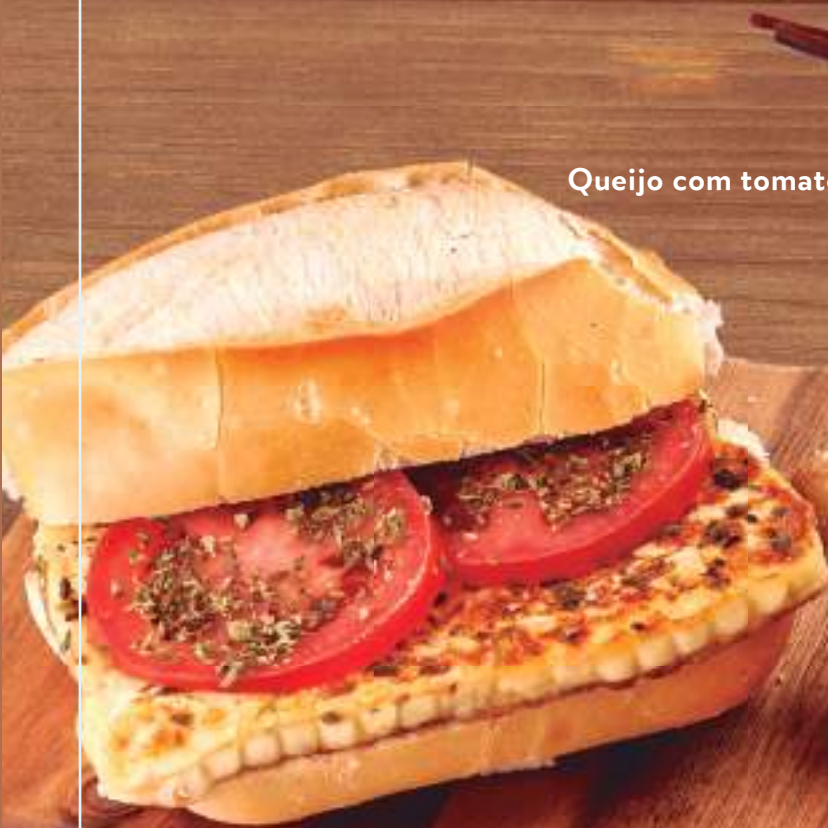
Queijo com tomate