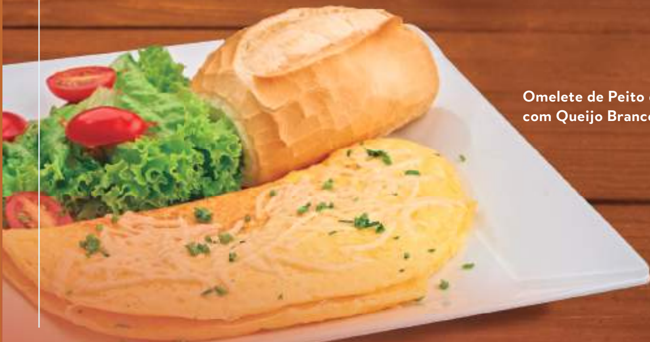
Omelete de Peito de Peru com Queijo Branco