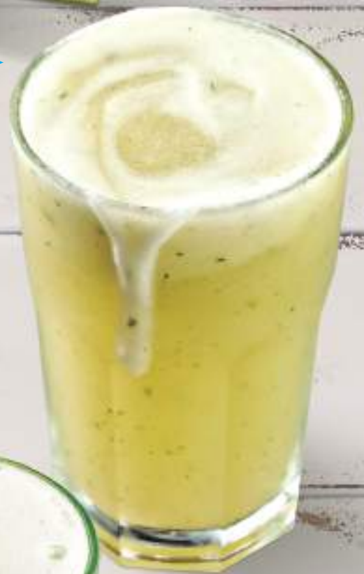
Abacaxi com hortelã