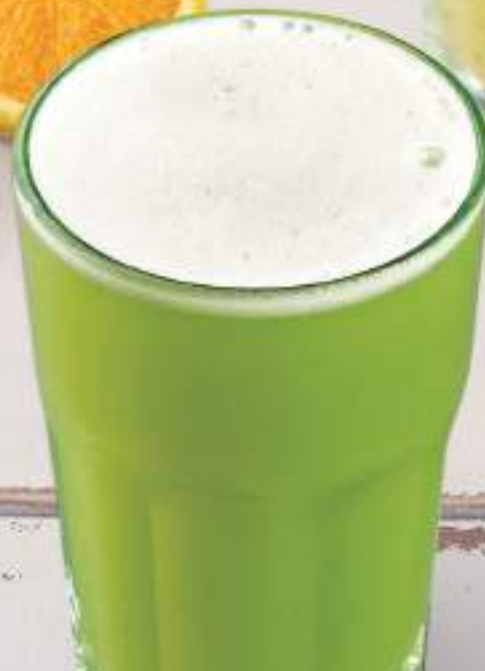
Água de coco e uva verde.